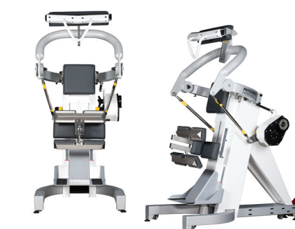
Тренировочный комплекс для туловища КОН-ТРЕКС TP