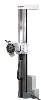
Модуль симуляции работы КОН-ТРЕКС WS