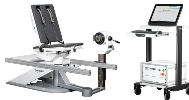
Мультисуставной комплекс КОН-ТРЕКС MJ в сочетании с модулями управления КОН-ТРЕКС PM-1 и PM-2