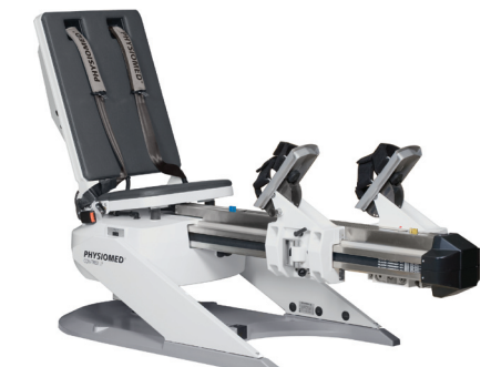
Линейный модуль для жима ногами КОН-ТРЕКС LP